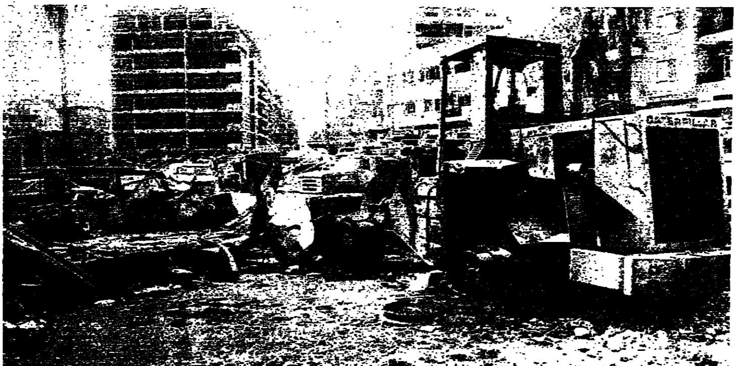
الدمر في البيات الدفاع المدني (جوزف فضول)